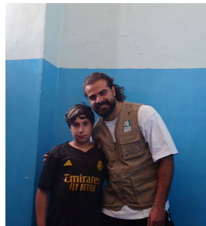
Un enfant accompagné d'un membre d'Asmae lors d'une distribution

Merci à Stop Hunger pour le financement de ces distributions.