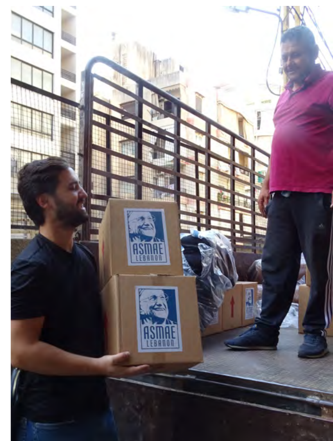
Distribution de kits d'urgence

Dans ce contexte de crise humanitaire, nous réaffirmons notre appel au respect du droit international humanitaire et soutenons les efforts pour une trêve immédiate. Il est impératif de protéger les civils et les infrastructures civiles.